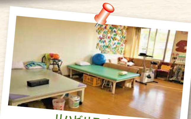
リハビリスペース