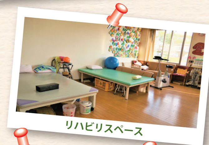
リハビリスペース